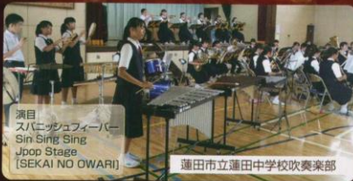
演目 スバニッシュフェーバー Sin Sing Sing Jpop Stage [SEKAI NO OWARI]