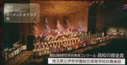
第63回全日本吹奏楽コンクール 高校の部金賞 埼玉県立伊奈学園総合高等学校吹奏楽部